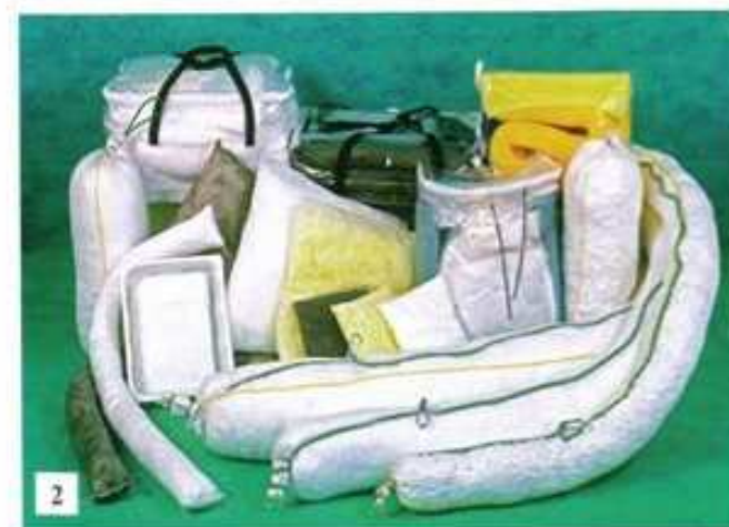
Рис. 1 и 2. Полипропиленовые сорбенты ECOSTAR

заправочных станций, а также экологи, пожарные, садоводы, т. е. все, чья деятельность так или иначе связана с необходимостью улавливать или максимально экономно расходовать различные виды жидкостей, включая опасные. В число важных преимуществ текстильных сорбентов ECOSTAR входит, прежде всего, безопасность для здоровья человека, простота обращения, высокие показатели сорбционной емкости, высокая скорость сорбции, хорошая сопротивляемость воздействию агрессивных веществ, а также — причем далеко не в последнюю очередь — возможность простой и экономичной утилизации.